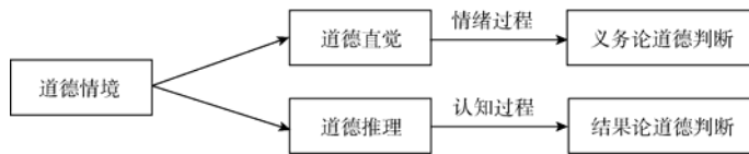
图 4 道德判断的双加工模型